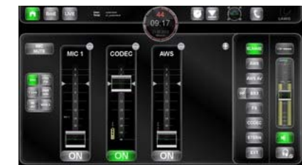
Abbildung 3: Steuerinterface