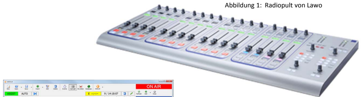
Abbildung 1: Radiopult von Lawo

Campusradio, Audio, Hardware, Radio, bit express